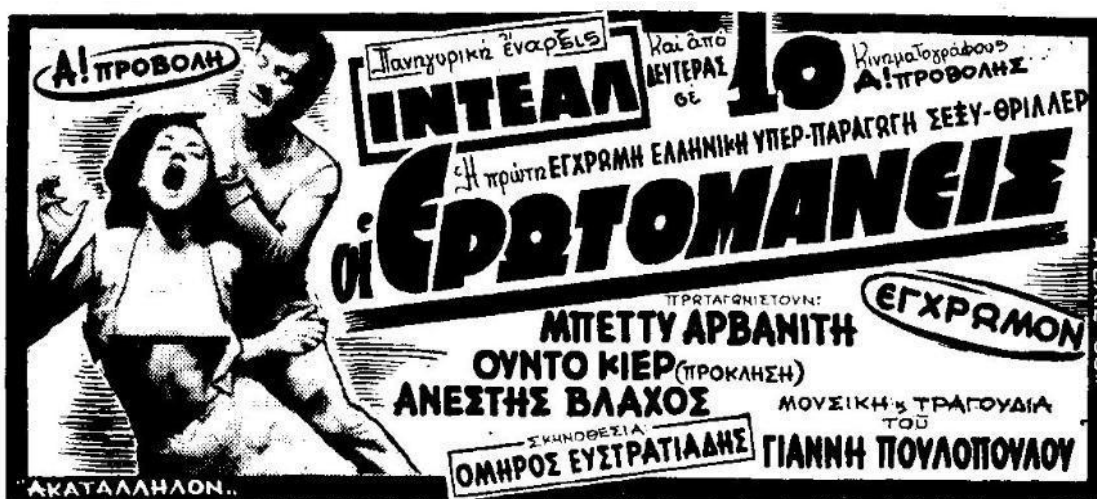
Εικ. 4: Διαφημιστική καταχώρηση της ταινίας Οι ερωτομανείς , που δημιούργησε αντιδικία μεταξύ Ευστρατιάδη-Αρβανίτη, στην εφημερίδα Τα Νέα (13/9/1972).

συνήθισε. Στο φιλμ, ο Τόνι παθαίνει τουλάχιστον δυο ισχυρές κρίσεις από στερητικά συμπτώματα, τα οποία μπορούν να λειτουργήσουν με παιδαγωγικό τρόπο για τον θεατή: να πού μπορεί να καταλήξει όποιος κάνει χρήση. Παράλληλα, και ο Βασίλης εμφανίζεται να κάνει ένεση στον Τόνι, ο οποίος για να καλύψει τα σημάδια από την Όλγα φορά στις φλέβες του χεριού του ένα τσιφότο. Ο σύζυγος της Όλγας την απατά συστηματικά και, μάλιστα, έχει «σπιτώσει» τη μαιτρέσσα του· η τελευταία δεν θα διστάσει να απατήσει τον Ιγγλέση για χάρη ενός μικρότερου διακινητή. Τέλος, στους Ερωτομανείς , όπως, εξάλλου, σε κάθε αντίστοιχη ταινία, οι ερωτικές σχέσεις αφορούν κυρίως παράνομες ή παράλογες για την ηθική της εποχής συνευρέσεις: ο εξωσυζυγικός έρωτας και η σχέση με νεαρότερο σε ηλικία άνδρα προφανώς και κατακεραυνώνονται.