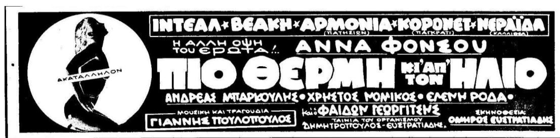
Εικ. 1: Διαφημιστική καταχώρηση στην εφημερίδα Τα Νέα (2/10/1972).

στρατηγική τους: παρόλο που τα φιλμ ήταν μαλακά, οι σχετικές διαφημιστικές καταχωρήσεις τους στον Τύπο τα αποκαλούσαν «αυστηρώς ακατάλληλα» στο πλαίσιο διαφημιστικής προβολής και περιλάμβαναν σύντομες «πικάντικες» αναφορές στους τίτλους τους χωρίς να υπάρχουν πορνογραφικά κινηματογραφικά ενσταντανέ (εικ. 1).